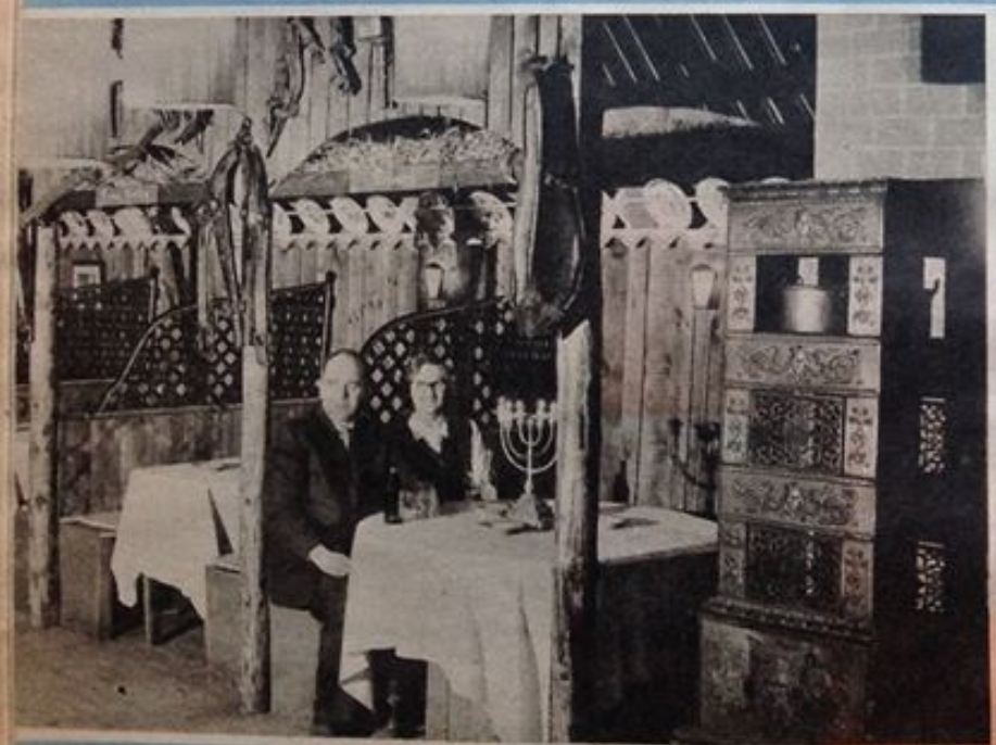
Ovnen i forgrunden var ikke til salg, selv om Nationalmuseet ville købe. Her har været hestestald.

Det er især kroens bryllupsgæster, der ser