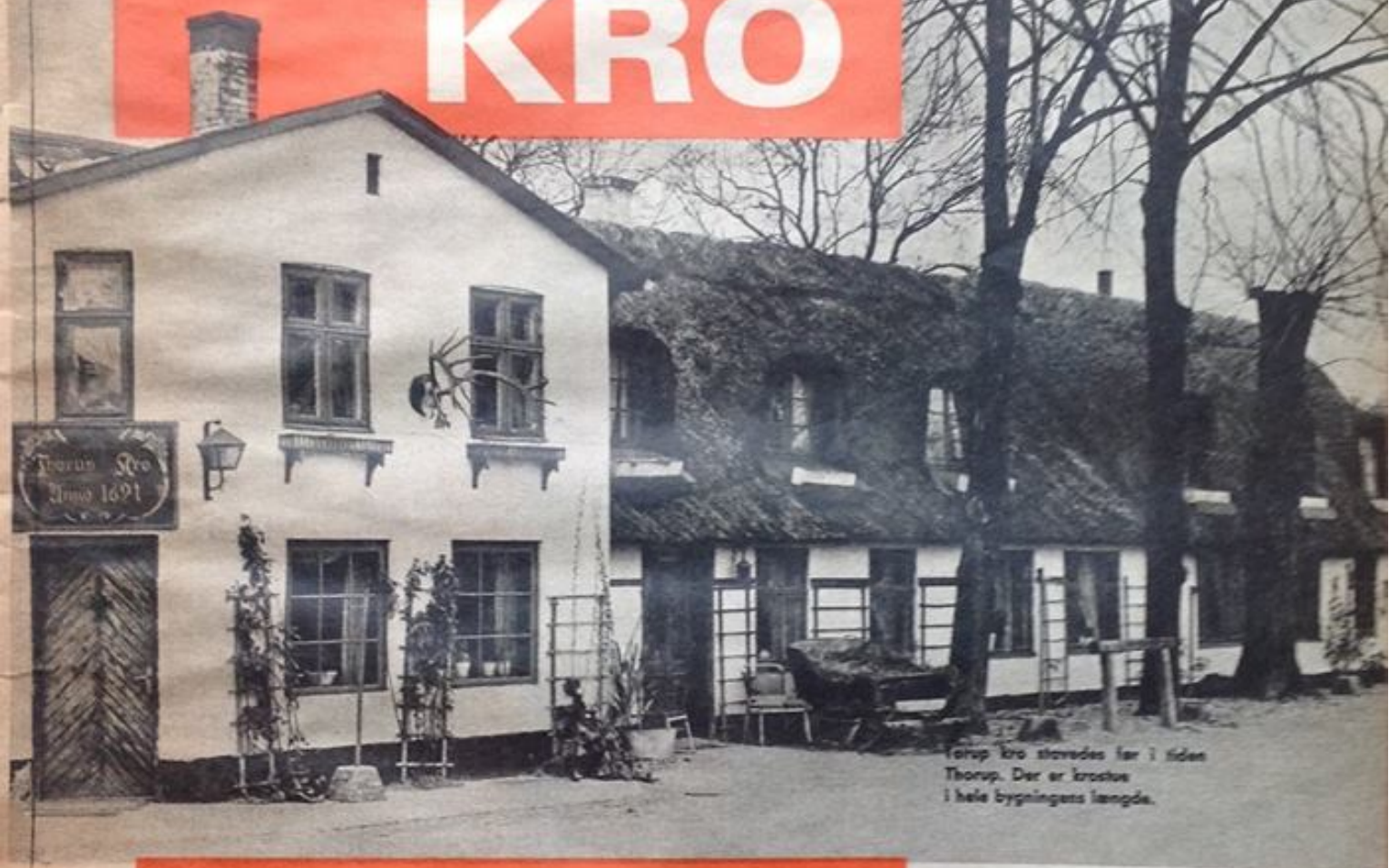
Torup kro stavedes før i tiden Thorup. Der er krosten i hele bygningens længde.