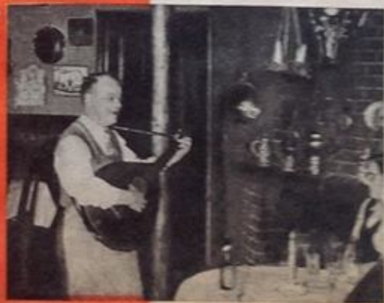
Krofar med sin lut. Den gav ham penge til kroen.