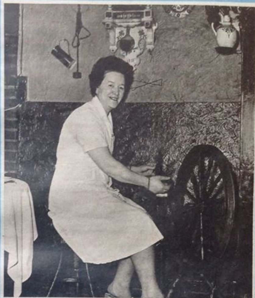
— Sådán en tingest kan jeg skam ikke håndtere, smiler krokonen ved rokken.